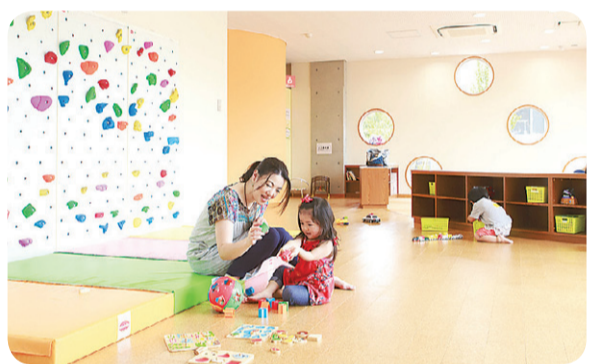
4月にオープンした「子どもセンターまあち」

“町田市”としても、ハード・ソフトの両面から日々の子育てを全力でサポートしています。