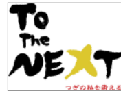
写真左: 2010年4月「ホテルニューオータニ幕張」で実施された「TO THE NEXT2010」の会場風景。アクティブシニア層の熱気がいっぱい 写真右: 「TO THE NEXT」のロゴマーク

このところ、当グループのリビング新聞では50代以上のアクティブシニア層に向けたイベントが頻繁に行なわれている。「TO THE NEXT～つぎの私を考える～」がそれ。団塊の世代をメインターゲットに、元気で自分らしく人生を楽しもうとする人々を支援するイベントだ。ネーミングの良さもあってか、昨年4月に幕張のホテルで実施された初めてのイベントは2000人以上の来場者数を記録した。